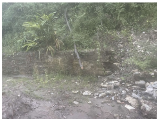
(विस्तृत विवरण बेरुजु दफा ५६.४ सँग सम्बन्धित अनुसूचीमा संलग्न छ ।)

५६.४ स्थलगत अवलोकन: चौकीडाँडा मुल सडक स्तरोन्नती तथा नाली व्यवस्थापन निर्माण कार्यको स्थालगत निरीक्षण गर्दा यस आर्थिक बर्षमा कार्य भएको कामको आइटमहरु Earth Work Excavation, PCC 1:2:4 र Stone Masonry लगायतमा बर्षाले क्षति पुर्याएको देखिन्छ । Detailed Estimate मा Machine made ग्यावियन जालीको लागत अनुमान तयार गरेको भए तापनि स्थालगत निरीक्षणमा र नापी किताबमा उक्त कार्य भएको देखिएन । ठेक्काको हकमा सार्वजनिक खरिद नियमावली, २०६४ को नियम १२५ अनुसार परीक्षण गर्ने त्रुटि सच्याउने दायित्वको अवधि समाप्त नहुँदै कुनै त्रुटि देखिएमा सार्वजनिक निकायले सोको यकिन गरी समयमा नै दाबी गर्नुपर्ने व्यवस्था गरेको छ । तर उपभोक्ता समितिबाट भएको कामको क्षति भएको कार्य उपभोक्ता समितिबाट कार्य गराउन नसकिने भएकोले यस्तो कार्यमा सुधार गरी निर्माण कार्य गर्नुपर्दछ ।